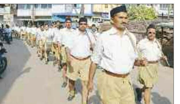
आरएसएस जगरनाथपुर मंडल द्वारा पथ संचलन।

आरएसएस गोरक्षप्रताप के तत्कालीन पथ संचलन कार्यक्रम सरस्वती शिशु मंदिर पक्कीबाग से प्रारंभ हुआ। भव्य झांकियों के साथ लगभग 250 की संख्या में गणवेशधारी विभिन्न मार्गों पर भ्रमण कर जनमानस को भारतीय संस्कृति व परंपराओं से जुड़े रहने की प्रेरणा दी। इस अवसर