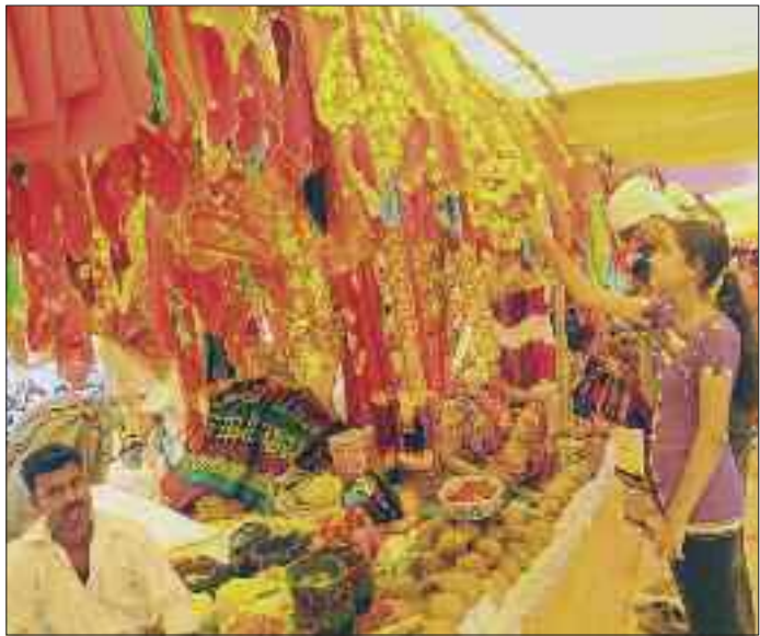
पूजन सामग्री खरीदते श्रद्धालु।